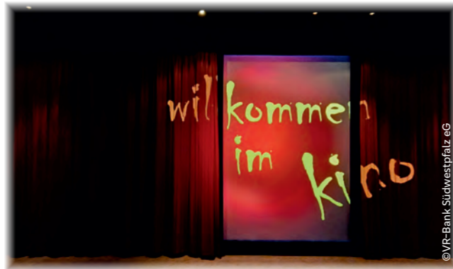
Walhalla-Kinocenter Pirmasens – Lassie

Im Jahr 2023 haben wir den Vorlesesommer in der Region unterstützt und damit einen wertvollen Beitrag zur Förderung der Lesekultur bei Kindern und Jugendlichen geleistet. Der Vorlesesommer ist eine Ergänzung zum weitaus bekannteren Sommerleseclub und füllt so eine Lücke für die Kleineren. Vorlesen fördert die Fantasie sowie die kognitiven Fähigkeiten von Kindern. Zudem stärkt es emotionale und soziale Kompetenzen. Alle Teilnehmer haben Bilder zu den vorgelesenen Büchern gemalt, um so das Gehörte kreativ zu verarbeiten.